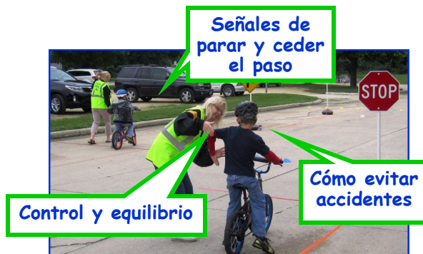
Estudiantes de Oelwein Community School District disfrutaron una prueba de habilidades durante su Festival de Bicicletas.

Los Festivales de Bicicletas enseñan a sus niños habilidades de supervivencia, necesarias para montar en bicicleta de manera inteligente y segura.